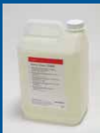
Saphira Damp Clean COMBI 5L

Le Saphira Blanket Conditioner peut être utilisé pour l'impression offset, heatset et coldset.