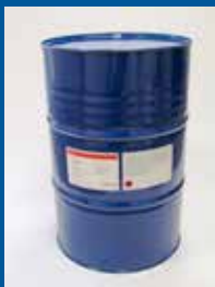
Saphira Wash 562-200L

Dans le secteur des produits de lavage, il y a actuellement une forte