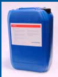
Saphira Wash 562-25L

demande de solutions plus performantes mais moins polluantes. Dans ce domaine, Saphira se distingue entre autres par le Saphira Wash 562 , un nettoyant innovateur pour les rouleaux et les blanchets qui vise à réduire la consommation et perfectionner les performances. Le Saphira Wash 562 est aussi adapté au nettoyage automatique et manuel des encres conventionnelles. En plus du Saphira Wash 562 , Saphira offre le Saphira Blanket Conditioner qui sert à enlever les résidus d'encre, les bavures de papier et le glaçage du blanchet. Grâce à ce produit, la surface de blanchet se régénère ce qui garantit un meilleur transfert d'encre et une durée de vie prolongée.