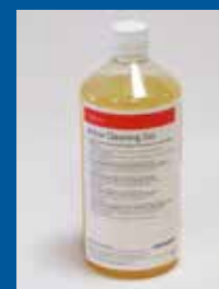
Saphira Anilox Cleaning Gel 1L

verniss. Le Coating Cleaner 590 peut être utilisé pour le lavage des blanchets pour vernis.