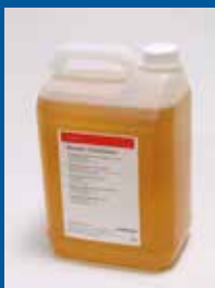
Saphira Blanket Conditioner 5L

demande de solutions plus performantes mais moins polluantes. Dans ce domaine, Saphira se distingue entre autres par le Saphira Wash 562 , un nettoyant innovateur pour les rouleaux et les blanchets qui vise à réduire la consommation et perfectionner les performances. Le Saphira Wash 562 est aussi adapté au nettoyage automatique et manuel des encres conventionnelles. En plus du Saphira Wash 562 , Saphira offre le Saphira Blanket Conditioner qui sert à enlever les résidus d'encre, les bavures de papier et le glaçage du blanchet. Grâce à ce produit, la surface de blanchet se régénère ce qui garantit un meilleur transfert d'encre et une durée de vie prolongée.