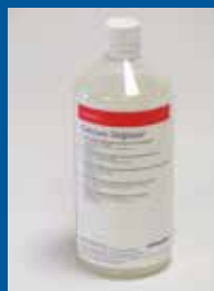
Saphira Calcium Deglazer 1L

Nous restons à votre entière disposition pour toute information supplémentaire à ce propos.