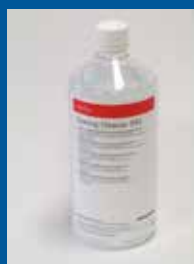
Saphira Coating Cleaner 590-1L

La valeur ajoutée des auxiliaires Saphira est assurée surtout en combinant des solutions écologiques, des performances, de la facilité d'emploi et de la diversité. Avec l' Anilox Cleaning Gel et le Coating Cleaner 590 , ces deux produits, en plus d'être à base d'eau, enlèvent très facilement les encres à base d'huile, d'eau, UV et les