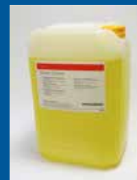
Saphira System Cleaner 25L