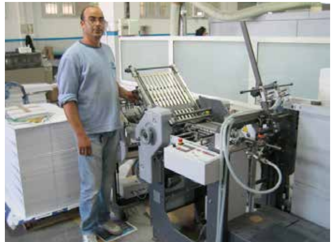
La TI 36 chez Imprimerie l'Orient